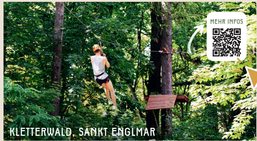
KLETTERRWALD, SANKT ENGLMAR

An aktuell 21 Stationen können Räder im Stadtgebiet Straubing ausgeliehen und zurückgegeben werden. Die nächste Station befindet sich 0,5km vom Genusshotel entfernt. https://bit.ly/3XzdnbJ