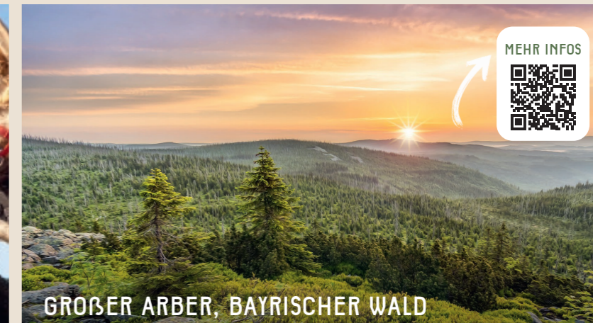
GROßER ARBER, BAYRISCHER WALD