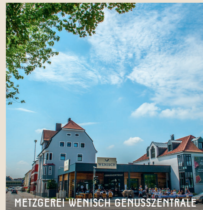
METZGEREI WENISCH GENUSSZENTRALE

TIPP: Mit unserem E-Scooter (es stehen 2 zu Verfügung) macht die Straubing-Tour doppelt so viel Spaß!