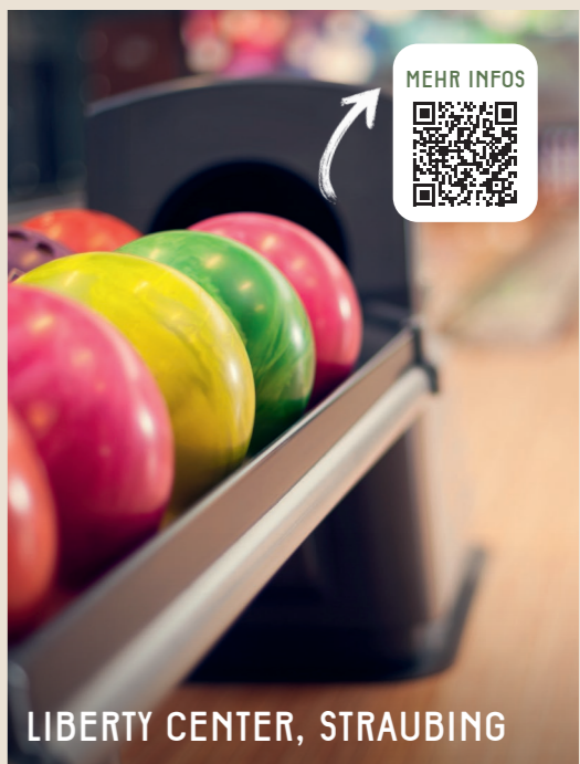
LIBERTY CENTER, STRAUBING