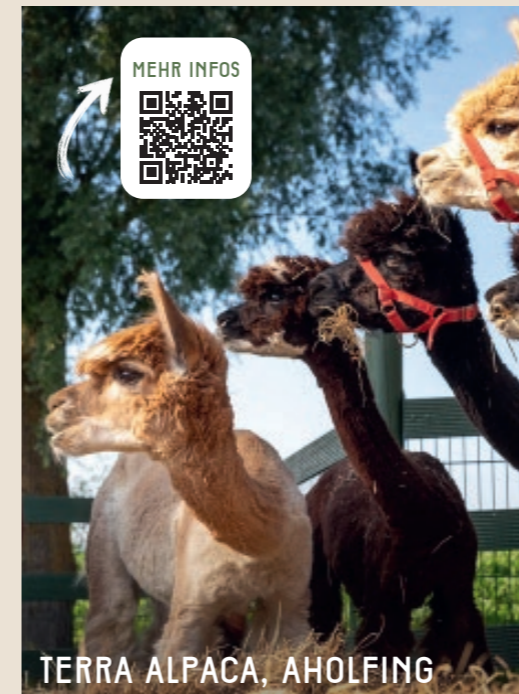
TERRA ALPACA, AHOLFING

Alternativ empfehlen wir – auf der anderen Seite der Oberpfalz – das Glasmuseum Frauenau , welches die Besucher mit auf eine Reise durch die Kulturgeschichte des Glases von den Anfängen im Zweistromland bis heute nimmt – Am Museumspark 1, 94258 Frauenau