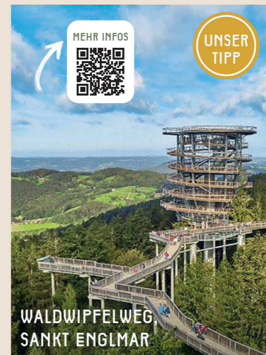
WALDWIPFELWEG, SANKT ENGLMAR